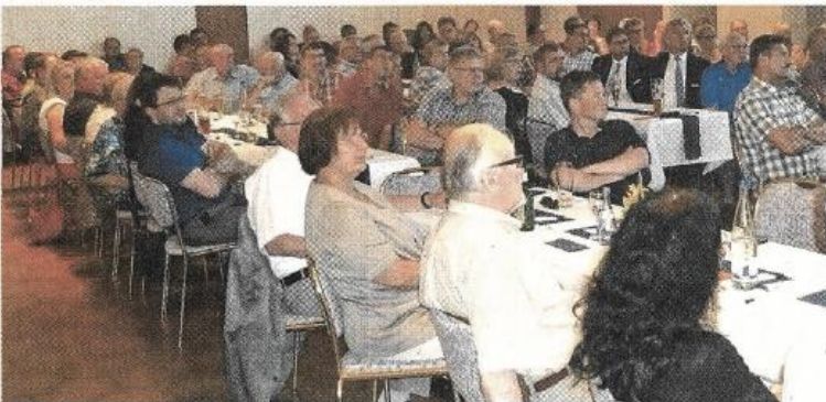
Gute besuchte 8. Generalversammlung der Bürgersolar Rothenburg im Rappen-Saal.

In der weiteren Tagesordnung votierten die 94 anwesenden Mitglieder einstimmig für die Gewinnverwendung und Rücklageneinstellung und beschlossen die Entlastung von Vorstand und Aufsichtsrat.